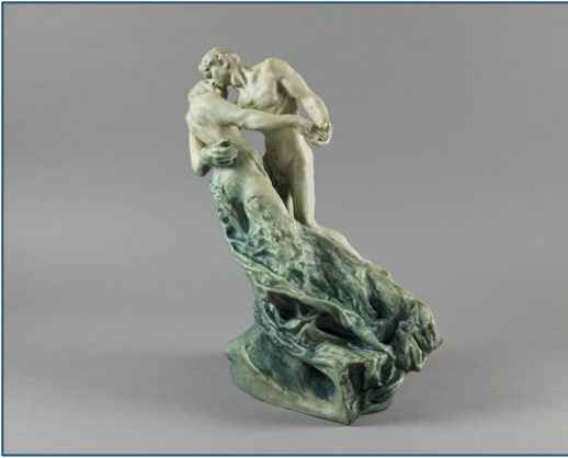
Camille Claudel, La Valse, 1889-1905 Nogent-sur-Seine, Musée Camille Claudel