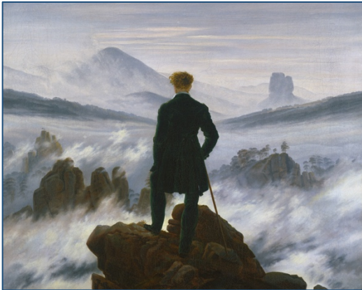
Caspar David Friedrich, Le Voyageur au-dessus de la mer de nuages , 1818 Hambourg, Kunsthalle

Elle est l'auteure d'œuvres restées célèbres, témoignages de sa virtuosité de sculptrice et de sa richesse d'inspiration. Trop souvent réduite à son statut d'élève, de collaboratrice, puis de maîtresse et muse de Rodin, Camille Claudel (1864-1943) n'en demeure pas moins une artiste unique, qui a cherché à s'émanciper de la tutelle de son maître pour affirmer sa propre identité de créatrice, caractérisée par la fluidité des formes, la performance technique et la polychromie.