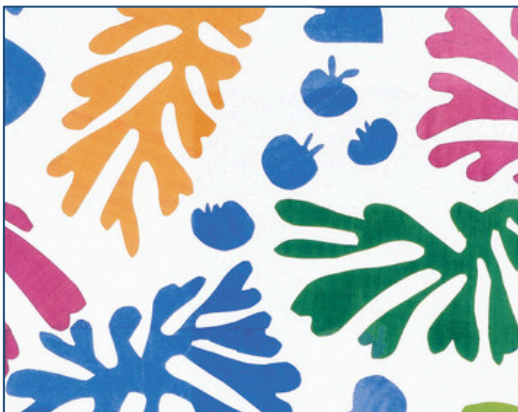
Henri Matisse, La Perruche et la sirène , 1952 Amsterdam, Stedelijk Museum / © 2014 Succession H. Matisse / Artists Rights Society (ARS), New York

Comment relever le défi de rendre visible l'invisible des songes ? Source inépuisable d'images et de visions hallucinées, le rêve a inspiré bon nombre d'artistes au fil du temps. Au gré des changements de perception et d'interprétation du phénomène onirique, les artistes se sont servis de son contenu et de son langage, pour produire des œuvres inattendues, aussi féériques que cauchemardesques, avant d'en faire le moteur même du processus créateur, à l'instar des surréalistes au XXe siècle.